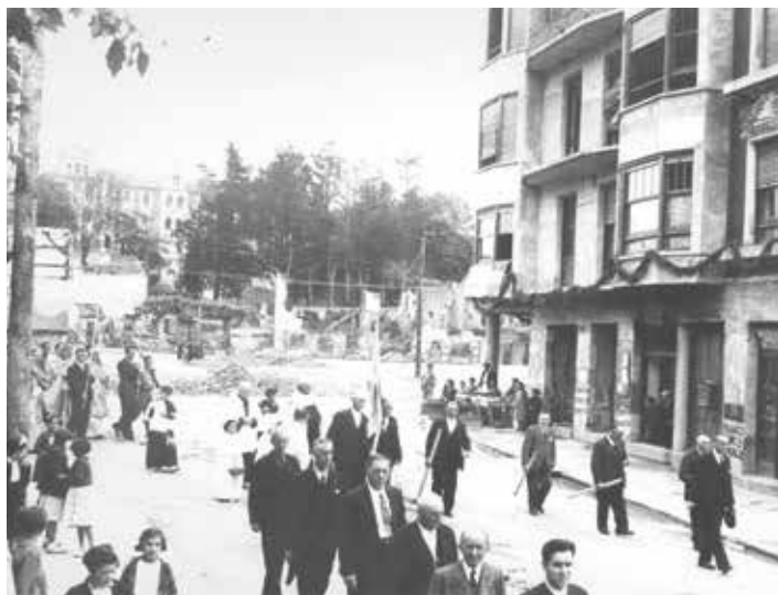
Desfile con el Calvario y El Carmelo al fondo