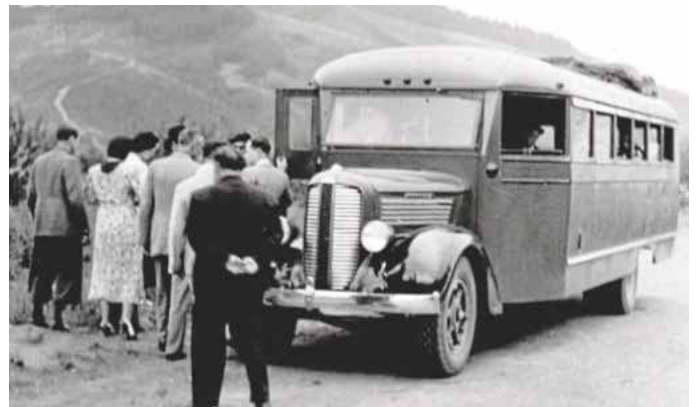
Grupo de turistas visitando los horrores de la guerra

AMOREBIETA, ADEMÁS DE SUFRIR MÚLTIPLES BOMBARDEOS AÉREOS Y EL ASEDIO DEL EJÉRCITO NACIONAL RESPALDADO POR FUERZAS ITALIANAS Y ALEMANAS, TUVO QUE SOPORTAR LA INSÓLITA VISITA DE UN GRUPO DE TURISTAS INTERNACIONALES. EN UNA MACABRA ANALOGÍA CON LOS ACTUALES "FREE TOURS", ESTOS VISITANTES RECORRIERON LAS CALLES DEVASTADAS DE AMOREBIETA SIGUIENDO A SU GUÍA FRANQUISTA.