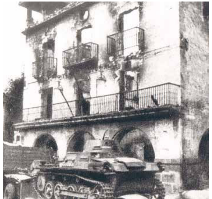
Tanques entrando en Amorebieta